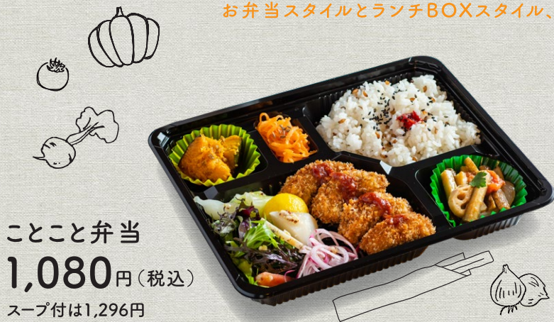
ことこと弁当 1,080円(税込) スープ付は1,296円