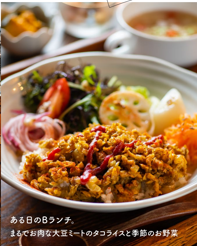
ある日のBランチ。 まるでお肉な大豆ミートのタコライスと季節のお野菜

※お肉を使わず、麹甘酒や塩麹などの発酵調味料で野菜の旨味を引き出したメニューです