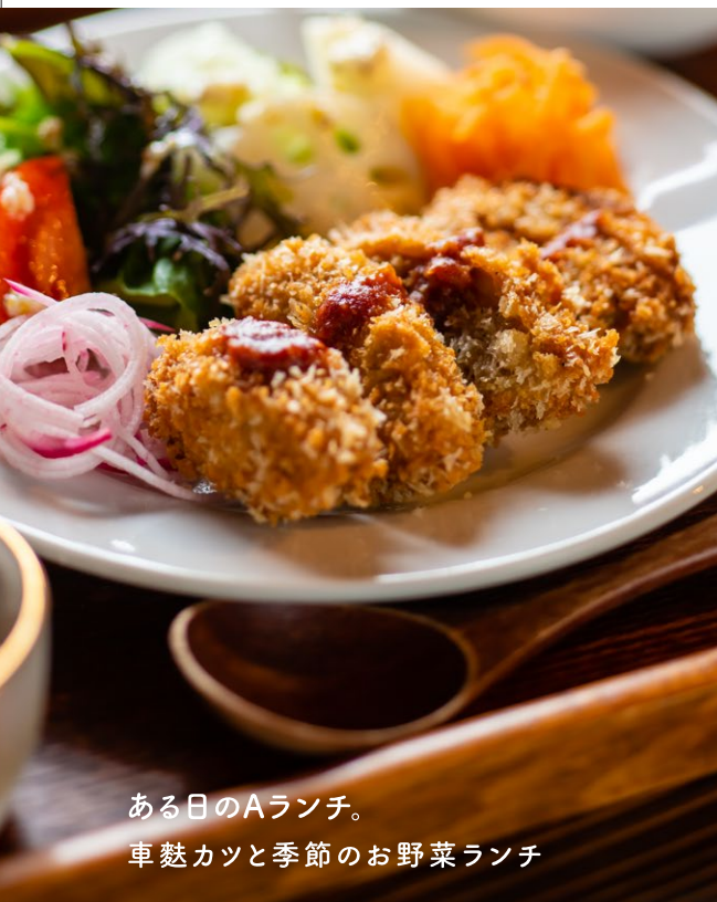
ある日のAランチ。 車麩カツと季節のお野菜ランチ